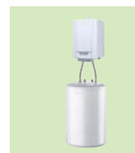
EMC-M / BS 80

H 55,4 cm B 36,8 cm T 36,4 cm 81 kg Speicher: H 91,2 cm • Ø 57 cm